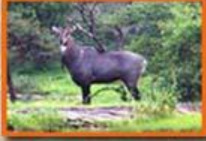
નિલગાય - રોમ