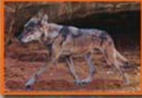
નાર - વરૂ