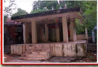
શ્રી બાંડીયાબેલી દાદા