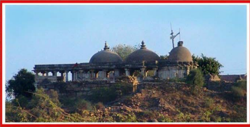
શ્રી જુનું સુર્ય મંદિર

સોનગટ-થાન-પાસે પ્રાચિન સુર્યમંદિર અને તરણેતરમાં સોલંકી યુગનું ત્રિનેત્રેશ્વર મહાદેવનું મંદિર આવેલું છે. તેમજ માંડવવન પાસે ઝરિયા મહાદેવનું મંદિર આવેલું છે. આ પ્રાકૃતિક સ્થળે શિવલીંગ પર પથ્થરમાંથી પાણીનો અભિષેક થયા કરે છે, અહીંથી થોડે દુર એક નહેરવાળાપીરની દરગાહ પણ આવેલી છે.